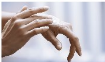
Leche de cabra